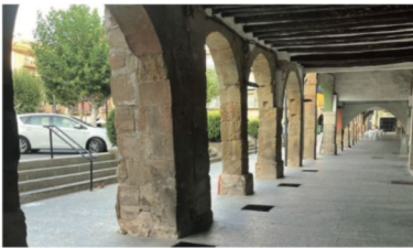
Porxada sud de la plaça del Mercadal