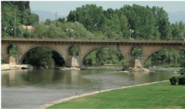
Pont de Sant Miquel