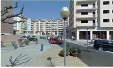
Plaça del Sagrat Cor